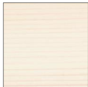
7393 Белый прозрачный